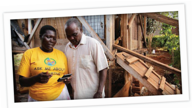
Grameen Foundation - Ouganda

En Ouganda, la Fondation Grameen a mis en place un système dans lequel 800 travailleurs du savoir communautaire ( Community Knowledge Workers - CKWs ) utilisent des téléphones mobiles pour fournir aux agriculteurs pauvres des informations en temps réel sur des sujets agricoles, notamment les prix du marché, et sont aidés par un centre d'appels dans lequel travaillent des experts agricoles hautement qualifiés, qui parlent les principales langues de l'Ouganda. Les CKWs documentent également les pratiques agricoles traditionnelles et les partagent via TECA (« technologies and practices for agricultural producers »), une plateforme en ligne qui facilite l'accès à l'information, accessible aux petits producteurs partout dans le monde.